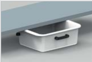
Säilytyslaatikko liukukiskoilla (691001-TER)