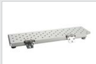
Läpiviennin kansipaketti (7003460-TER)