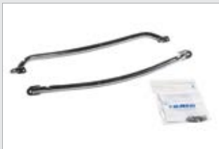
Saiman kaidepari, kirkas (750021-TER)