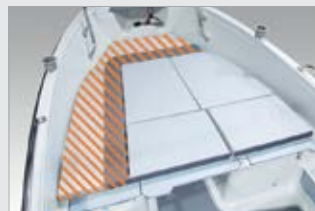
Aurinkotasot ja -tyynyt (744505-TER)