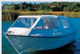
Ajokuomu, korkea (54553-TER)