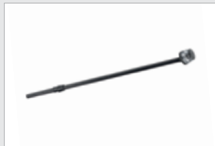
Valomasto 750 mm (703571-TER)