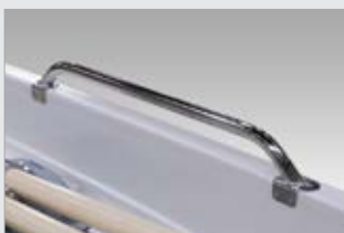
Sivukaidepari, kirkas (7407110-TER)