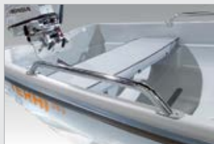
Sivukaidepari, kirkas (7407110-TER)