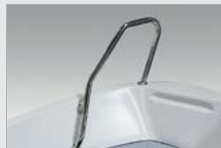
Etukaide hainevä, kirkas (740470-TER)