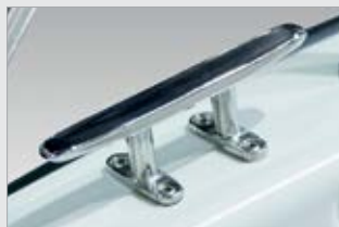
Knaapi, kirkas (747561-TER)