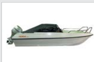
Satamapeite 480 Sport (5475131-TER)