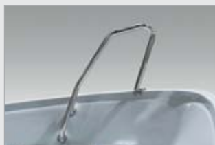
Etukaide hainevä, kirkas (740481-TER)