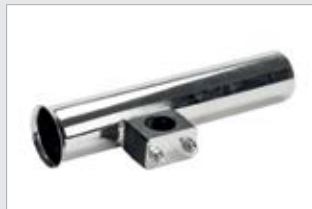
Vapaputki, kiillotettu (700600-TER)