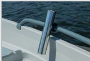
Vapaputki, kiillotettu (700600-TER)