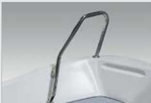
Etukaide hainevä, kirkas (740470-TER)