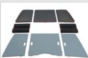
Aurinkotasojen ja -tyynyjen (749001-TER)

Kuomukotelo peräpenkin takana Monipuoliset säilytystilat keulassa, perässä ja pulpeteissa Mukitelieet Ohjauslaite/ajopulpetit Sadevesityhjentyvyys Sammutin Sähköinen automaattinen pilssipumppu Teleskooppimela Terhi-äyskäri Tuulilasi Uimaporras Välivioli