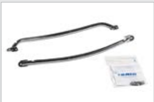
Saiman kaidepari, kirkas (750021-TER)