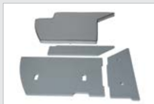
Aurinkotasoa ja -tyyny (74573-TER)