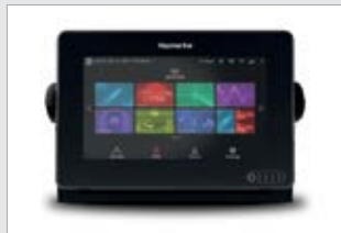
Raymarine Axiom 7-DV (7999221-TER)