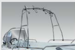
Targakaari, kiillotettu (700610-TER)