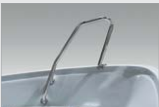
Etukaide hainevä, kirkas (740481-TER)