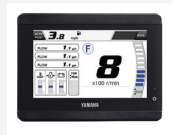
5. 5" värinäyttö - kierros-luku - trimmaustaso - varoitukset - veneen nopeus - polttoaineen määrä - polttoaineen kulutus