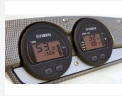
3. LAN-mittaristo - kierros-luku - trimmaustaso - varoitukset - veneen nopeus - polttoaineen määrä - polttoaineen kulutus