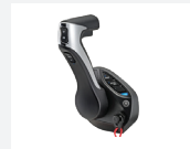
4. Sähköinen kauko-ohjainta (DBW)