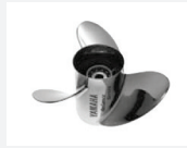
8. Teräspotkuri, kiillotettu