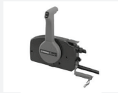
1. Kauko-ohjaintalaitte 703