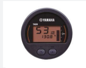
2. LAN-mittari - kierros-luku - trimmaustaso - varoitukset