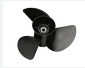
7. Teräspotkuri, musta